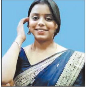
बीटेक सेकेंड ईयर में थी अध्ययनरत, सुसाइड नोट में ममी पापा से मांगी माफ़ी

रायगढ़ जिले के पूंजीपथरा स्थित ओपी जिंदल यूनिवर्सिटी में बी-टेक सेकेंड ईयर की एक छात्रा ने मौत को गले लगा लिया। झारखंड की रहने वाली छात्रा ने आत्महत्या से पहले एक भावुक सुसाइड नोट भी छोड़ा है, जिसमें उसने अपने परिवार में से माफ़ी मांगते हुए अपनी असफलता और माता-पिता की मेहनत की कमाई खर्च होने का गहरा अफसोस जताया है।