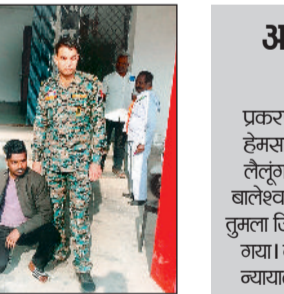
आरोपियों को मेजा गया न्यायिक रिमांड पर

रायगढ़। खाद्य निरीक्षक की शिकायत पर लैलुंगा पुलिस ने ओडिशा राज्य से अवैध रूप से धान लाकर उसे छत्तीसगढ़ के किसानों के नाम पर उपार्जन केंद्र में बेचने के प्रयास के मामले में सख्त कार्रवाई करते हुए दो आरोपियों को गिरफ्तार कर न्यायिक रिमांड पर भेज दिया है।