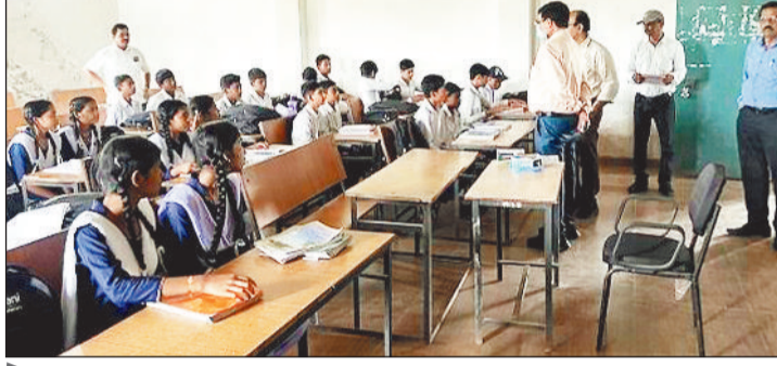
डी ग्रेड के स्कूलों का अब अफसर व जनप्रतिनिधियों करेंगे निरीक्षण

स्कूलों की गुणवत्ता बढ़ाने मुख्यमंत्री शिक्षा गुणवत्ता अभियान की शुरूआत की गई थी। अभियान के तहत प्राथमिक से हायर सेकेंडरी तक के विद्यार्थियों की पढ़ाई का मूल्यांकन किया गया। पहले चरण में 8 अक्टूबर तक राज्य शैक्षणिक अनुसंधान एवं प्रशिक्षण परिषद की ओर से तैयार प्रश्नपत्रों के जरिए विद्यार्थियों की परीक्षा ली गई। जिला स्तर के अधिकारी स्कूलों के निरीक्षण करने पहुंचे। उन्होंने बच्चों से बोर्ड पर लिखवाया और साथ ही पुस्तकें भी पढ़वाईं। रिपोर्ट के अनुसार इस अभियान के दौरान जिले 400 से अधिक स्कूलों का प्रदर्शन बेहद कमजोर मिला। रिपोर्ट के अनुसार प्राथमरी, मीडिल और हाई स्कूलों को मिलाकर कुल 409 स्कूलों को डी ग्रेड मिला है। इन स्कूलों में संसाधनों की कमी, किताबें समय पर नहीं मिलना, स्टाफ की अनुपस्थिति और सिलेबस अधूरा पाया गया। इनमें सबसे अधिक 250 प्राथमरी स्कूल जबकि 100 मीडिल और 59 हाई स्कूल का प्रदर्शन खराब मिला है। जिले के कई स्कूलों में तो बरामदे में कक्षाएं संचालित की जा रही हैं और कुछ स्कूलों में कर्मचारी कमी होने की वजह से दो पालियों में पढ़ाई करवाई जा रही है।